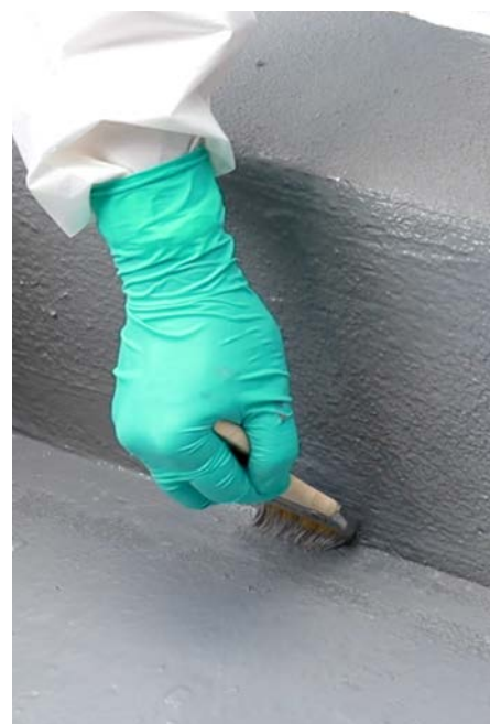
Auftrag mit Pinsel

Technische Einzelheiten entnehmen Sie bitte dem Produktdatenblatt (PSS) und der Verarbeitungsanleitung (IFU) von Belzona 5815.