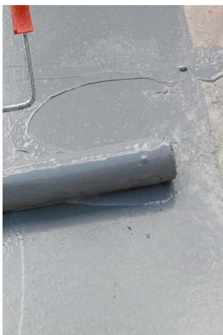
Auftrag mit einer Rolle

Die Beschichtung kann mit Pinsel, Rolle, Spachtel und Airless-Spritzgerät aufgetragen werden. Es ist in zwei verschiedenen Farben erhältlich (grau und khaki), um den Auftrag der beiden Beschichtungen zu erleichtern.