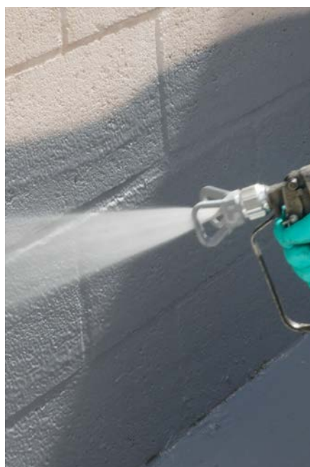
Auftrag mit Airless-Spritzgerät