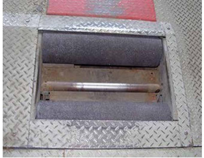
Antriebsrollen - 12 Jahre nach der ursprünglichen Anwendung immer noch in ausgezeichnetem Zustand

Belzona 1821 ist gegen das Abreiben, Abblättern und Abnutzen im Laufe der Zeit geschützt und behält die gleiche Rutschfestigkeit bei wie beim ersten Auftragen.