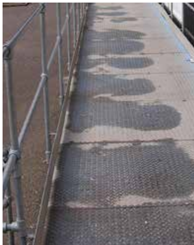
Polierte Stahlrampe vor dem Beschichten