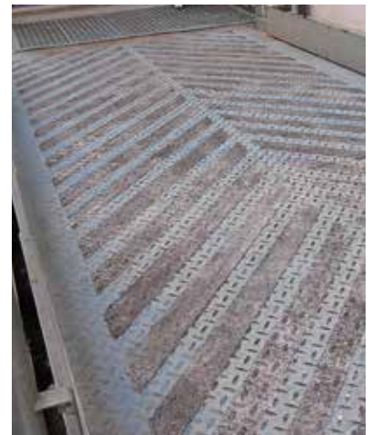
Rampe mit Belzona 1821 Streifen

Weitere Informationen erhalten Sie von Ihrem Belzona-Ansprechpartner vor Ort.