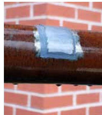
Anwendung auf nassen oder verölten Oberflächen