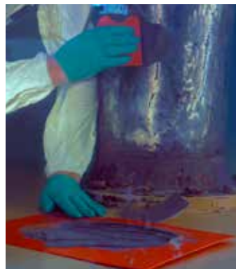
Anwendung unter Wasser